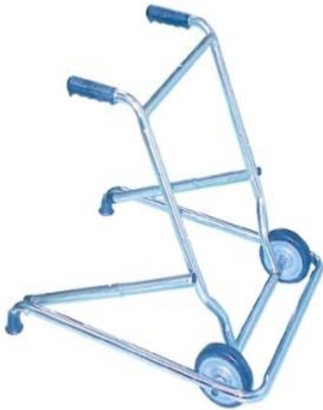
圖二：前推式助行器