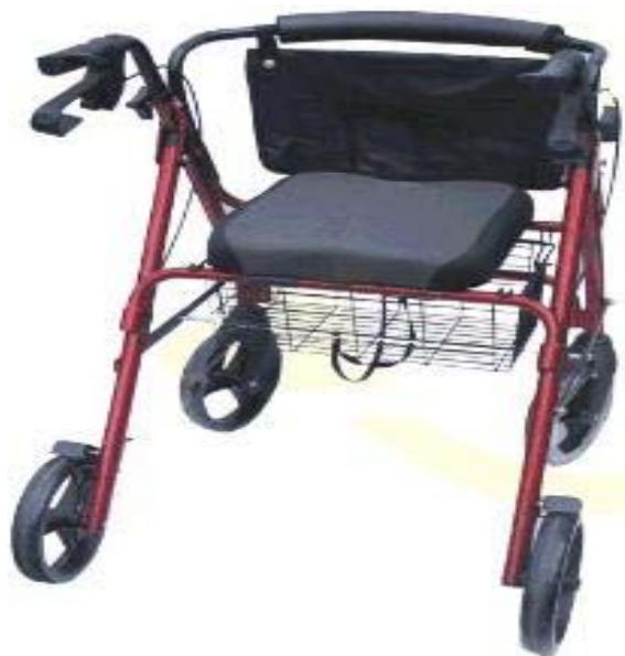
圖四：四輪推車，附休息座椅