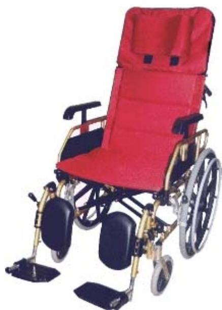
可調角度躺式輪椅