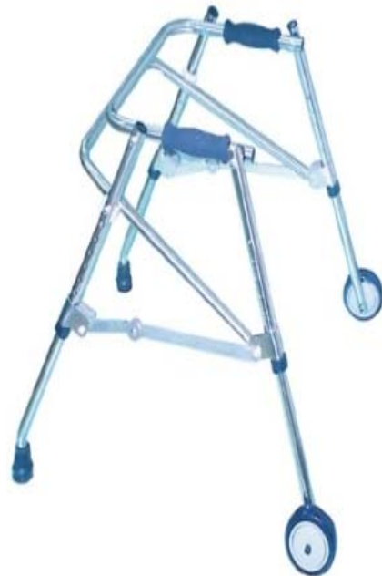
圖三：後拉式助行器