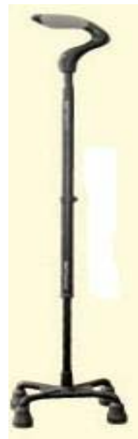
圖二：輕量化四角拐