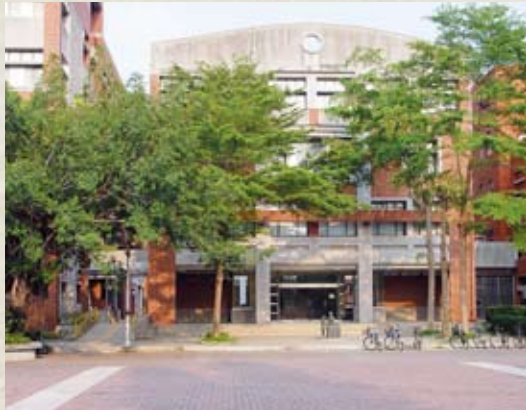
College of Management