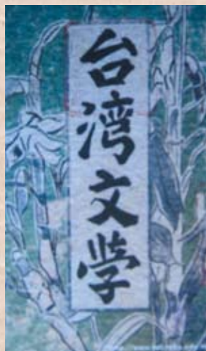
Department of Taiwanese Literature