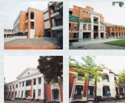
College of Planning and Design

依據本院現況及核心理念，為達成永續·創意·智慧的核心價值，本院將積極與結盟學校及產業界共同合作發展，特聘國外學者專家前來授課之外，亦邀請共同參與合作研究計畫。透過未來智慧生活實驗體之實驗平台，跨領域的專家學者共同研發創意生活科技，與國際頂尖的創意機構聯盟，共同進行國際合作案。